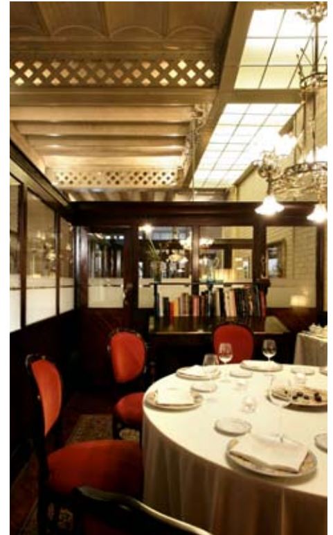
La Casa-restaurante Calvet

Las reservas hay que realizarlas al menos 48 horas antes.