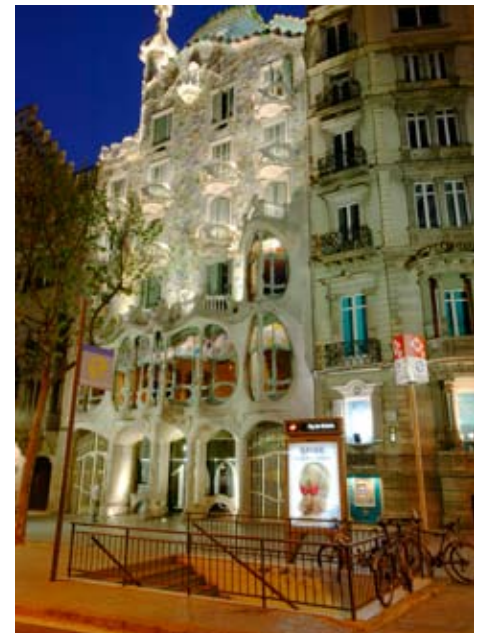
La Casa Batlló