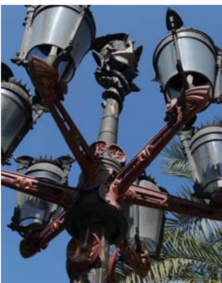
Farolas de la Plaza Reial

Un descanso en el delicioso Parque de la Ciutadella puede deparar sorpresas al fiel seguidor de Gaudí y amante del paisajismo. Allí puede admirar una monumental fuente con cascada que realizó el arquitecto de joven, cuando trabajó como ayudante de Josep Fontseré, quien diseñó el parque.