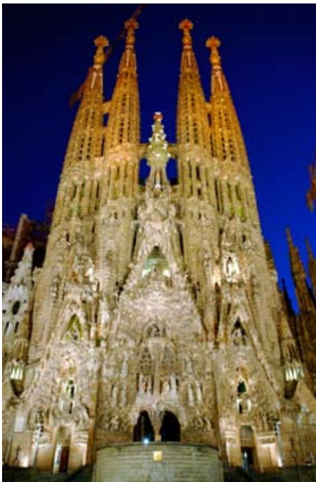
La Sagrada Família

La obra del arquitecto catalán está repleta de referencias a la religión y a la Naturaleza. La geometría de sus edificios imita las formas naturales, adoptando imágenes del mundo marino, vegetal y animal. Incluyó en sus edificios formas de troncos de palmera, hiedras y reflejos del agua porque "todo sale del gran libro de la Naturaleza". Su misticismo le inspiró a la hora de crear formas elevadas e ingravidas, como las torres de la Sagrada Familia. Gaudí era un auténtico devoto que quiso dedicar su vida a la arquitectura porque formaba parte de una misión encomendada por Dios. Su figura, marcada por este fervor religioso, se encuentra en proceso de canonización.