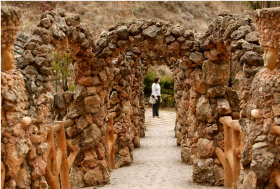
Jardines Artigas, puente de los arcos