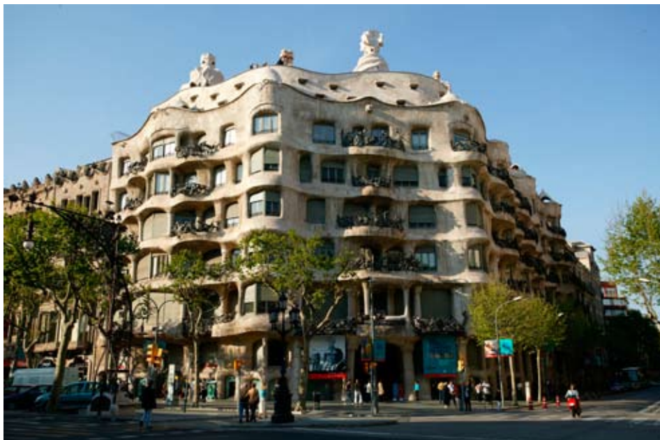
La Casa Milà

Dirección: Passeig de Gràcia, 92. Teléfono: +34 93 484 59 00. Metro: Passeig de Gràcia (L2, L3, L4) y Diagonal (L3, L5). Abierta todos los días.